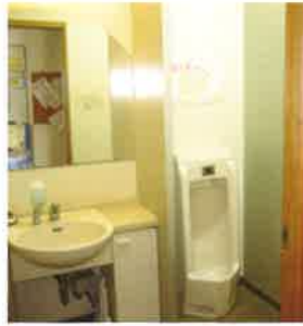
ホテルトイレ(消臭・抗菌)