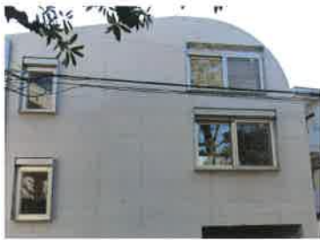
コンクリート(防汚)